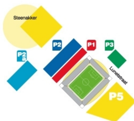
Figuur 3.2: Parkeerplaatsen rond het stadion van NAC Breda

Er ligt een fietsenstalling aan de zuidkant van het stadion. Er komen naar schatting per wedstrijd ongeveer 3.000 supporters op de fiets naar het stadion. Het stadion is per bus goed bereikbaar, onder meer in tien minuten vanaf Breda CS. De website van NAC Breda moedigt supporters aan om te carpoolen. Om de parkeerdruk op de omgeving van het stadion te verminderen, is geprobeerd om een speciale buspendeldienst op te zetten. Dit had een beperkt effect en is daarom in mei 2011 stopgezet. De huidige parkeerdruk leidt ertoe dat supporters mede parkeren in nabijgelegen wijken.