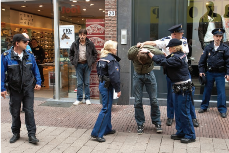
De regiopolitie Gelderland-Midden oefent in de Arnhemse binnenstad (7 april 2011).