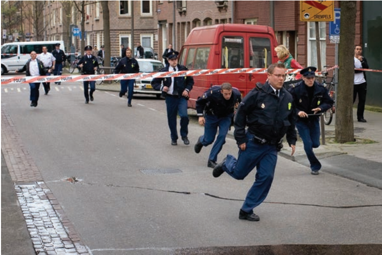
In de Amsterdamse Westerparkbuurt komen ongeveer tien dienders aangerend om collega-agenten te assisteren die bij de arrestatie van twee Marokkaanse jongemannen op collectief verzet stuiten (11 april 2007).