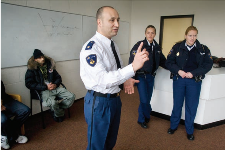
Leerlingen van de politieschool krijgen praktijkles over de omgang met Marokkaanse jeugd (5 december 2008).