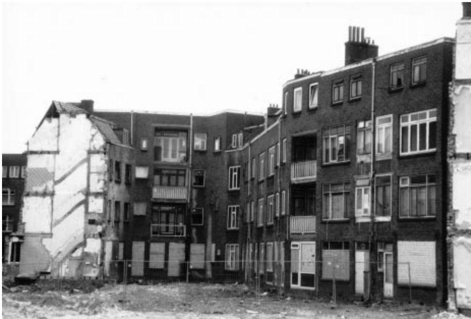
Verpaupering, langdurige leegstand en massale verhuizingen in de Millinxbuurt

Een attractieve woonomgeving, wijk of buurt werpt symbolische barrières op voor dealers, drugsgebruikers en drugsdelinquenten: het wijst op een wig tussen gekoesterde woonkwaliteit en overlast of criminaliteit.