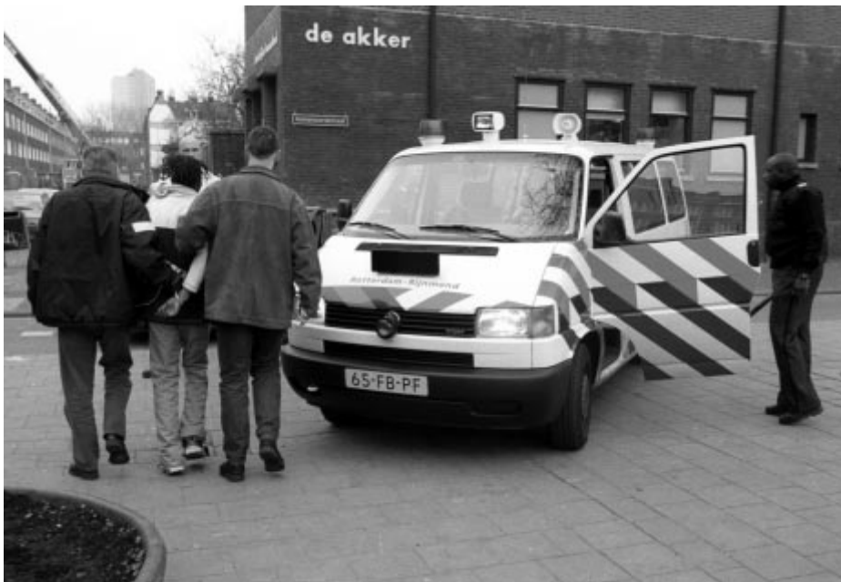
De arrestatie van een straatdealer (Millinxbuurt, maart 2000)

In een verhuilde scene is het de vraag hoe panddealers reageren als een buurt voor hun minder aantrekkelijk wordt vanwege renovatie, sloop, politie-invallen of aangescherpt woningtoezicht. Mogelijk zullen enkele drugskooplieden andere goederen of diensten verkopen, bijvoorbeeld door te investeren in horeca, onroerend goed of een minderhedeneconomie. Anderen kunnen proberen te herinvesteren in de drugshandel. Hiertoe dienen zij in de eerste plaats over geschikte verkooplocaties te beschikken, in veel gevallen gehuurde woningen. Andere mogelijkheden zijn: in een gekocht pand dealen of drugs verkopen vanuit kroegen of andere horeca-inrichtingen. Wie niet in staat is een geschikt overdekt verkooppunt te vinden, en wel is verstrikt in de drugshandel, verplaatst de handel mogelijk naar de straat. Dit is voor een dealer een stap terug die hem 'zwaarder werk' oplevert.